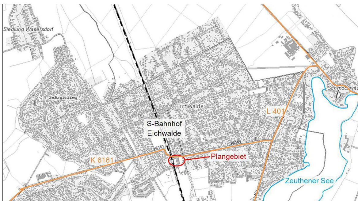
Lage in der Gemeinde

Die Gemeindevertretung Eichwalde beschließt, Fehler bei der ursprünglichen Beschlussfassung zum Bebauungsplan Nr. 23 „Gewerbegebiet“ vorsorglich durch ein ergänzendes Verfahren gemäß § 214 Abs. 4 BauGB zu heilen. Der Geltungsbereich umfasst unverändert die Flurstücke 46, 47, 48, 53, 54, 55, 67, 70, 71, 189, 190, 191, 196, 197, 198, 199 und 221 der Flur 10, Gemarkung Eichwalde, wie in der Anlage 1 dargestellt.