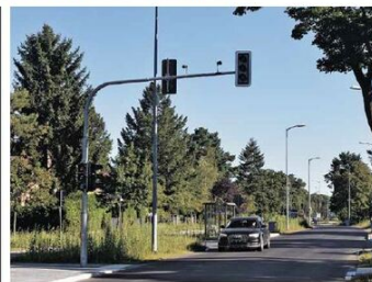
Heimat Die Zeidlerer Straße ist wieder offen. Das ist wunderbar, zumal die Bauarbeiten sehr viel eher beendet werden konnten, als geplant. Wie man weiß, ist das alles andere, als selbstverständlich, man denke nur an den Bahnhof Eichwalde. Mehr dazu auf Seite 11.

Schmückwitz Inselblatt Was bei unseren Nachbarn so alles los war: Vom Bootskorso über das 600. Ortsjubiläum bis zur Eröffnung des neuen REWE-Marktes. - ab S. 21