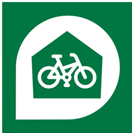
Logo Radpark

Weitere Informationen hierzu, die genauen Standorte sowie das Gestaltungskonzept finden Sie auf der Projektseite des VBB .